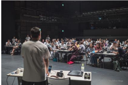
ファシリテーターを派遣