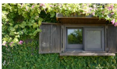
高齢者住まい看取り研修