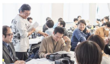
マネジメントスタンダードプログラム for kaigo (MSP-k)