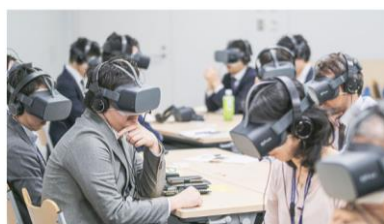
VRダイバーシティ&インクルージョン