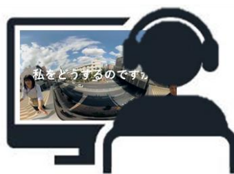
パソコンなどのデバイスで視聴