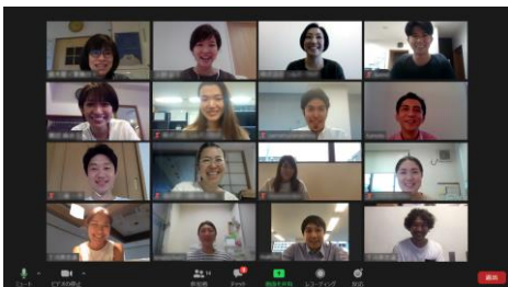
Web会議システムを活用