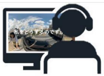
パソコンなどのデバイスで視聴