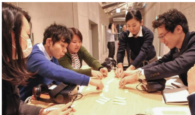
グループディスカッション

LGBT×VRの体験会は、参加人数分のVR機材とファシリテーターを派遣して実施する120分前後のプログラムです。3つのコンテンツを体験し、体験ごとに参加者同士で「本人の視点に立ったときに何を感じ何を思ったか」を話し合い、さらに制作を担当した弊社の当事者の実体験をお伝えしながら、セクシュアルマイノリティの当事者を取り巻く社会課題の本質に迫る内容です。