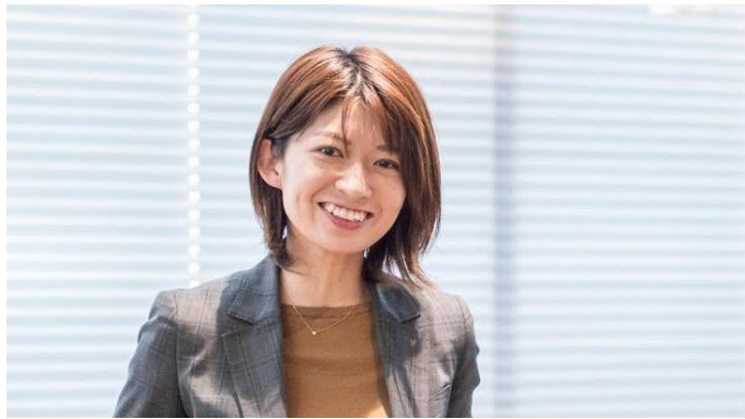
当事者兼制作担当の実体験をもとに解説