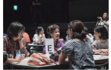
グループディスカッション