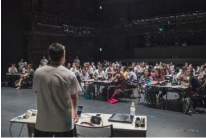
ファシリテーターを派遣