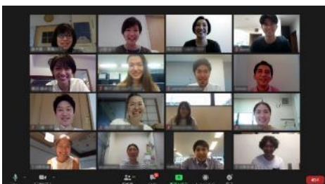
Web会議システムを活用